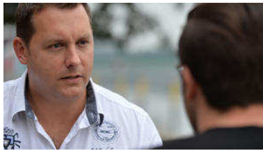
Seit 15 Jahren betreibt Eiben seine Agentur 'Alibi-prof'.

Wer will, erhält sogar ein "permanentes Alibi" über Jahre